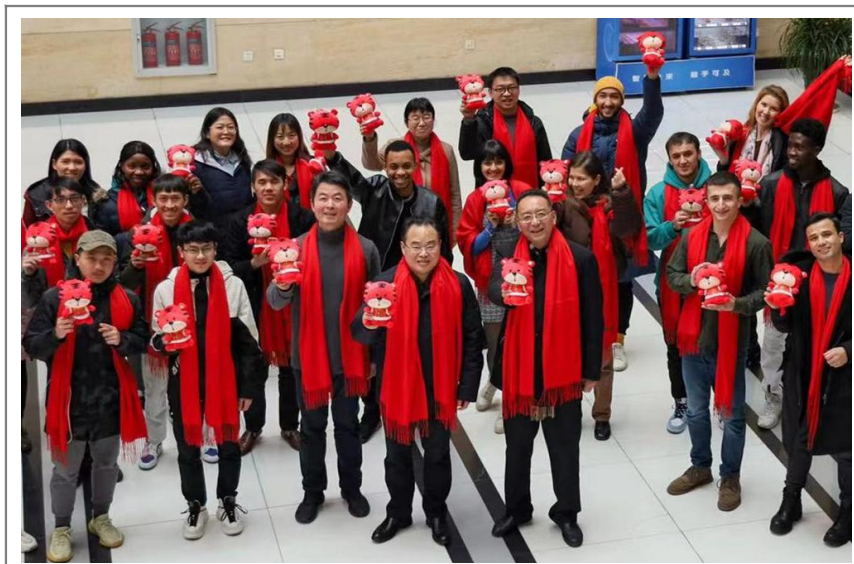
1 月 28 日,学校举行“申情‘应’有你,一起向未来”2022 年留校学生新春座谈会。校党委书记郭庆松出席,与留校学子亲切交流并送上新年礼物和新春祝福。(党委学工部)