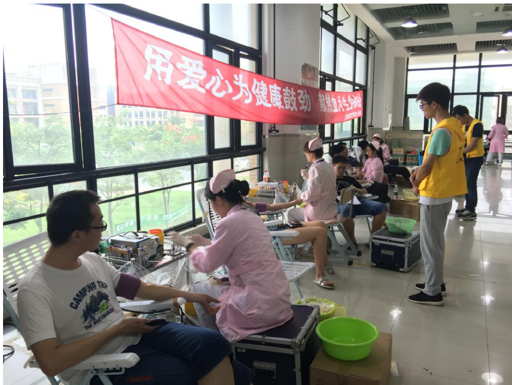
9月27、28日,我校无偿献血活动在奉贤校区二食堂二楼举行。7个学院762名师生参与献血,师生们用无言的行动践行着“人道、博爱、奉献”的红十字精神。

校园电影院的建设工作是今年学校重点完成的实事项目之一。在与二十一世纪校园数字电影院线有限公司进行充分洽谈沟通之后,9月初正式启动建设工作。建成后校园电影院将从十月份开始进入运营模式。